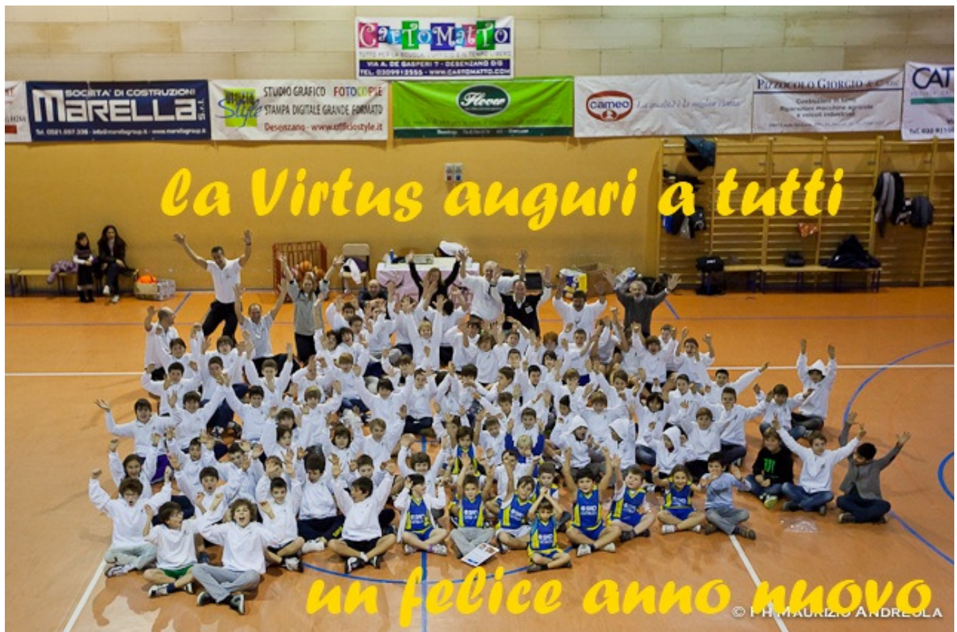
La carica dei centouno... e più

Una bella fetta di panettone e un brindisi augurale, meglio se analcolico, segnano la fine di un anno da ricordare.