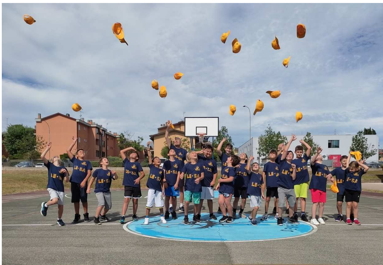
Il Camp di luglio 2021

Che gioia immensa tornare a proporre i nostri soliti appuntamenti! Già avevamo cominciato, pur tra mille dubbi e perplessità, a luglio 2021 con il Dragons' Camp. Pochi i partecipanti, ma il seme era stato gettato... L'idea di ripresentarlo in maniera ridotta la settimana prima dell'inizio delle scuole ha invece incontrato un'accoglienza strepitosa, con 41 aderenti: da ripetere assolutamente, anzi da raddoppiare!