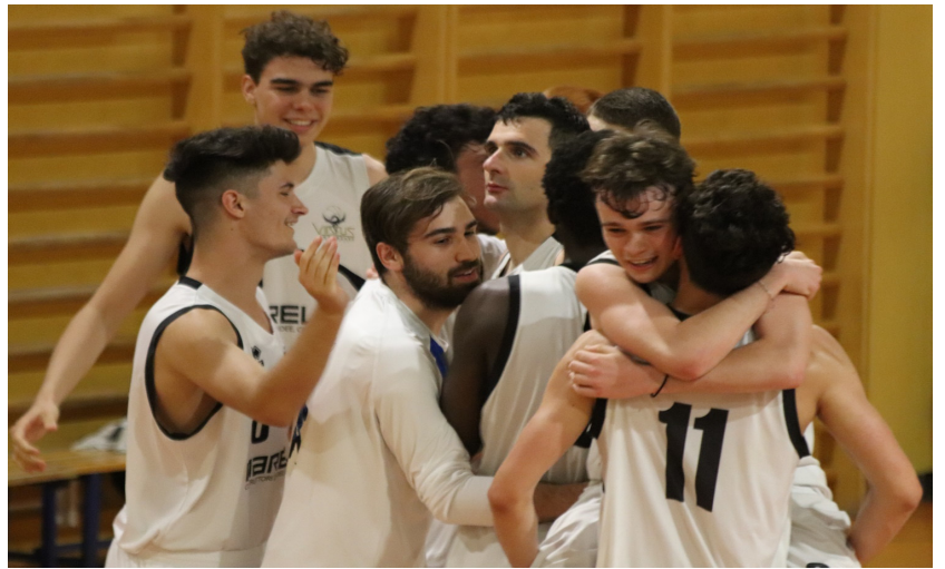
La gioia dei nostri ragazzi di Prima Divisione dopo il playoff vinto su Bovezzo