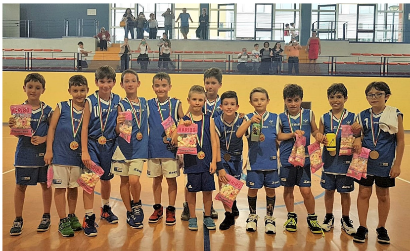
La formazione di Spring Desenzano, trionfatrice nel torneo Four Seasons