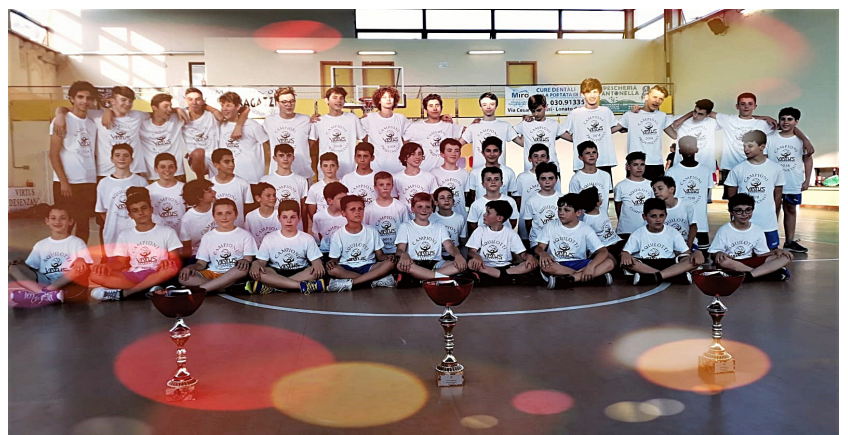
Le tre squadre che hanno vinto il titolo provinciale: Under 15, Esordienti e Aquilotti