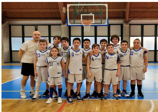
Aquilotti Big a Rezzato

ai nostri Draghi), e in appena cinque giorni! I nostri ragazzini del 2013 vincono a Montichiari, poi si recano a Travagliato con i 2014 (e qualche 2015) per far riposare i più grandicelli e si portano a casa un altro successo. Domenica di nuovo in campo in casa con Salò, ma stavolta è troppo e lasciano strada agli avversari. Insomma, una vera indigestione, e non è finita! Non indichiamo i prossimi programmi perché sono sempre modificabili, ma saranno di sicuro tanti!