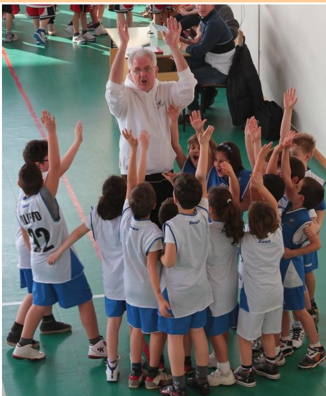
Uno, due, tre, Virtus!

Dopo il battesimo davvero di fuoco della doppia sfida al Barghe (troppo forti e dotatissimi alcuni bambini della Valsabbia, che peraltro già calcano i palcoscenici dei campionati veri), questi ultimi due mesi potranno dare un metro di giudizio più credibile, sempre che si possa già dare un giudizio sulle qualità "tecniche" in così tenera età... Insieme alle società amiche di Carpenedolo, Montichiari e CB del Chiese ci saranno due appuntamenti importanti per gli Scoiattoli (terza elementare) e altrettanti per i Pulcini (prima e seconda): veri e propri tornei a cinque squadre che si disputeranno a Castelgoffredo, a Carpenedolo e