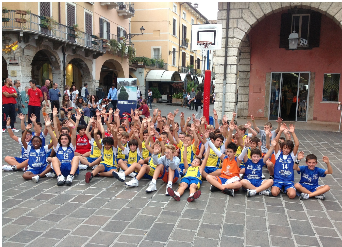
Foto di rito e arrivederci all'anno prossimo, data già fissata a domenica 22 settembre 2013, quando protagonisti saranno i ragazzi del 2002!

sempre nel rispetto di una correttezza esemplare. Al termine di una bellissima giornata di vero sport, resa ancor più gradevole dalla temperatura ideale, le squadre vengono premiate con la stessa coppa, a sottolineare il carattere assolutamente amichevole della manifestazione.