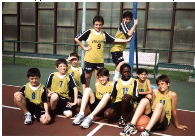
Draghi a riposo tra una gara e l'altra...